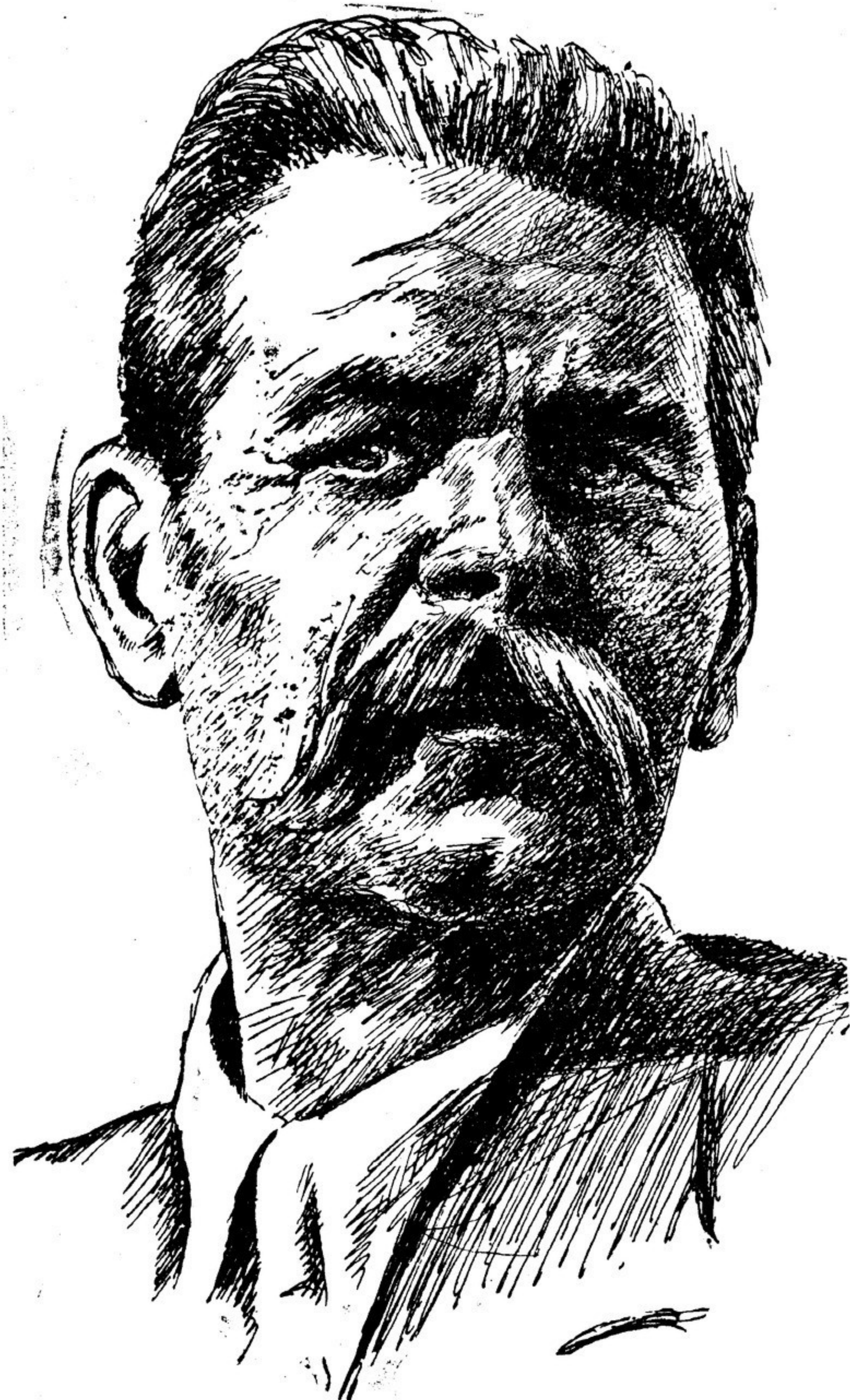
Рис. художника А. Ламма.

18 июня—пятнадцать лет со дня смерти М. Горького